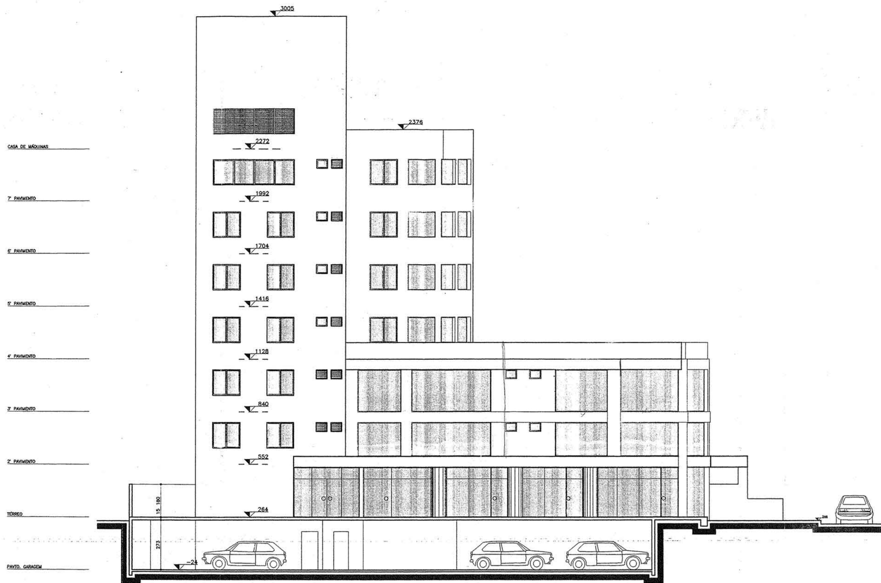
ELEVAÇÃO LATERAL ESC. 1/100