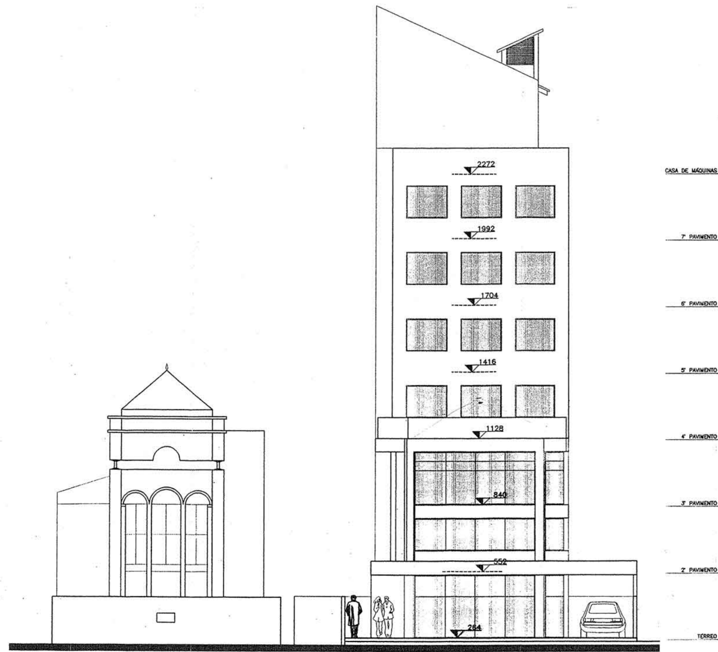
ELEVAÇÃO FRONTAL ESC. 1/100